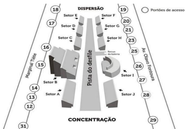
Imagem de Referência - Passarela cultural